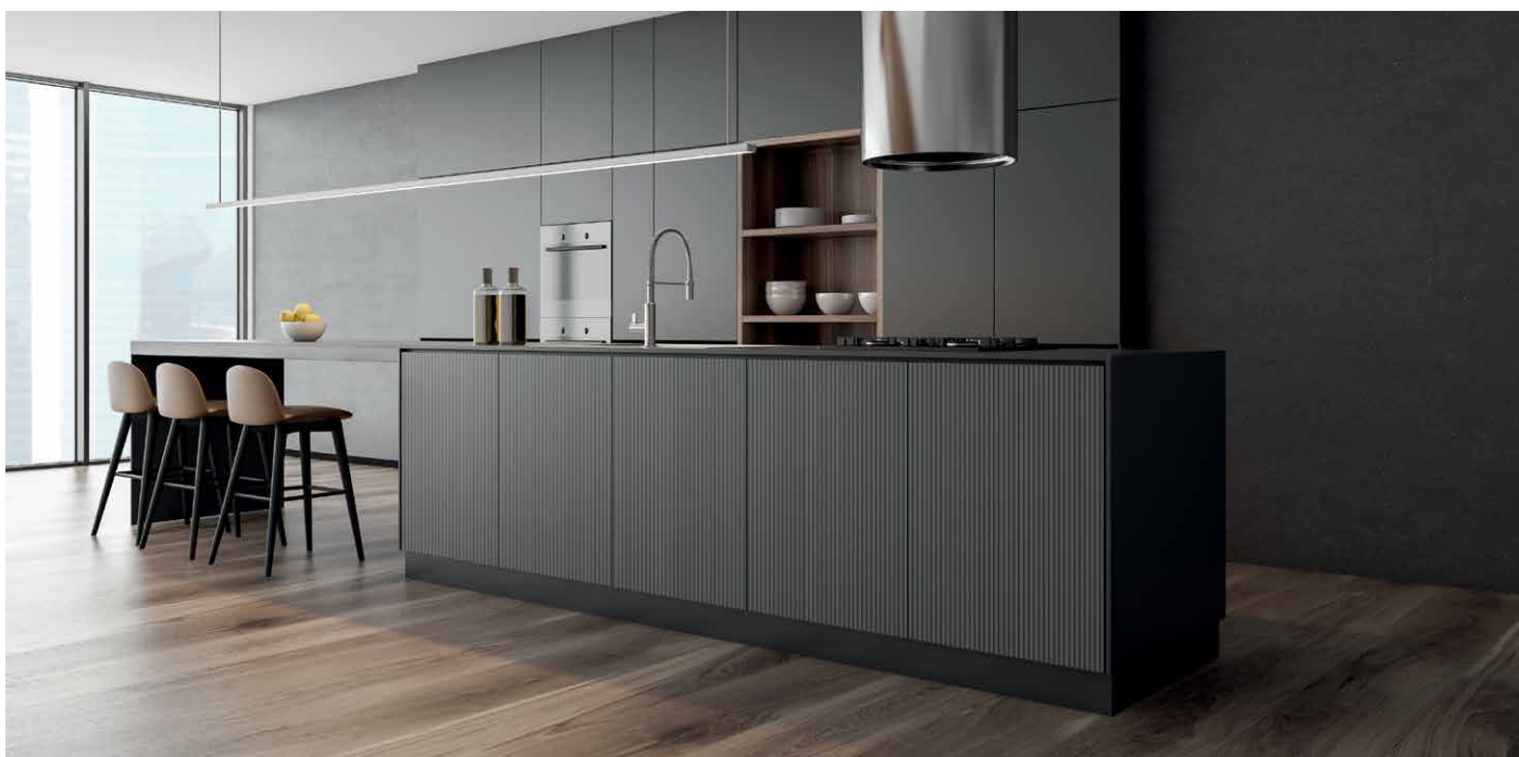
Möbelfronten Oro Nero – Façades de meubles en Oro Nero