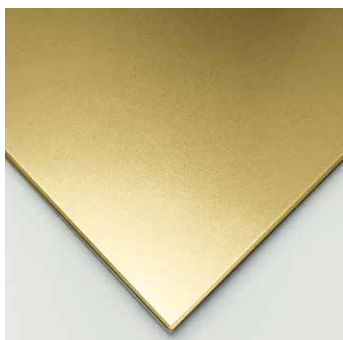
Oro 24 K